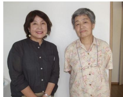
左から平塚理事、森田理事