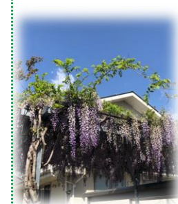
南沢事業所の藤棚は今年も満開です。